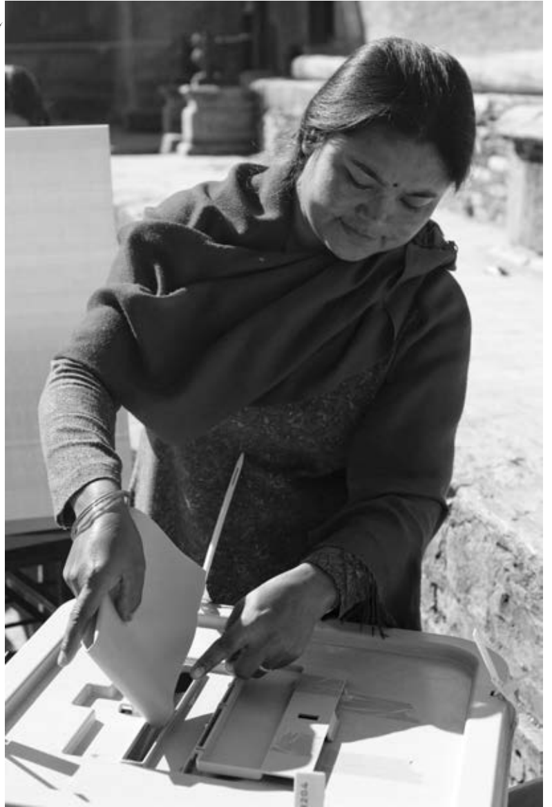
कीर्तिपुरमा एकजना महिला आफ्नो मतदान गर्दै ।